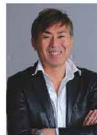
写真家 水谷たかひと