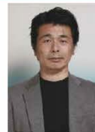
写真家 秦 達夫